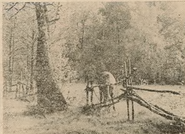
Осень за околицей встретила меня, Забросала золотом рощу и поля, Взбила пелену облака в синеве небес, И хмельной от свежести засыпает лес...